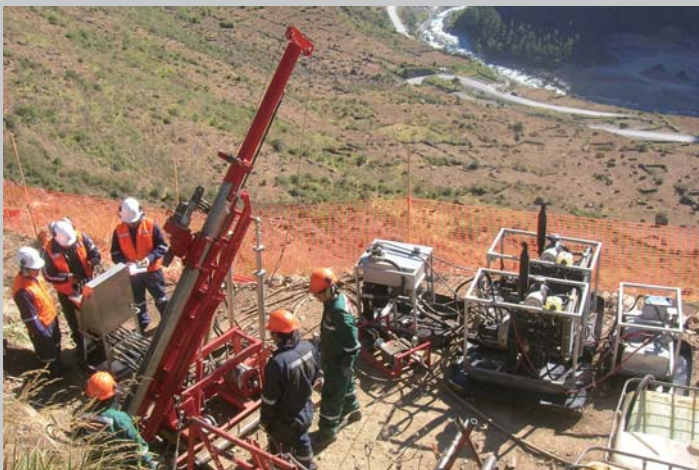
Explorer Jr. 36D